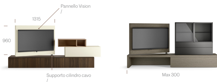
VISION SU PIANALE SP60